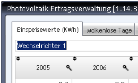
Bild1: Über der Tabelle kann hinterlegt werden, auf was sich diese Tabelle bezieht. Z.B. „Wechselrichter 1“ oder „Süddach“.