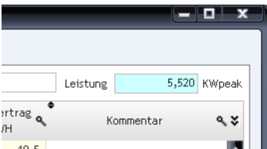
Bild2: Im blauen Eingabefeld wird die Leistung der Module hinterlegt, die an diesem „Wechselrichter“ angeschlossen sind. Hier im Bild sind dies 5,520 KW – oder anders: 5520 Watt. Es ist nicht die Leistung des WR. Die hier hinterlegte Leistung wird in Auswertungen verwendet.